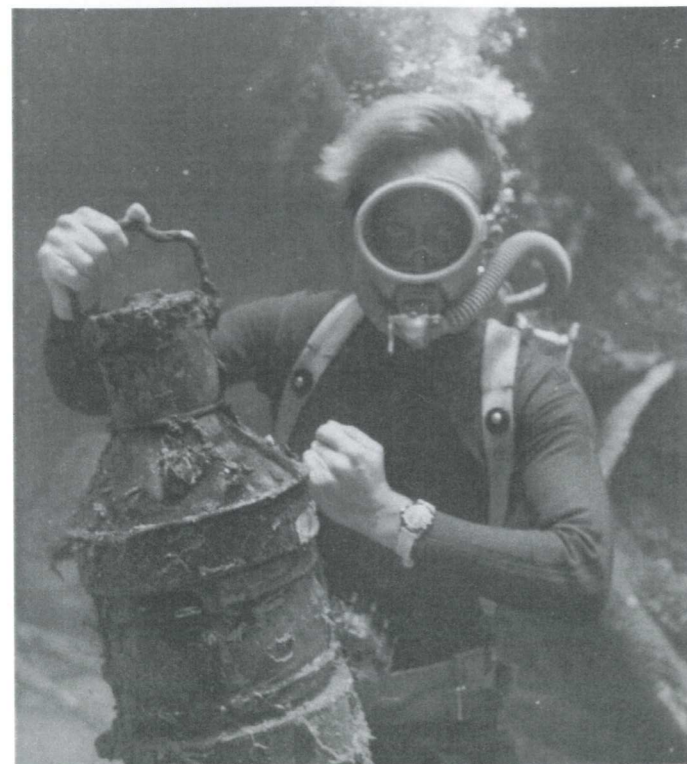
Am „Lampenwrack“ vor Tillanchong/Nikobaren konnten viele wertvolle Stücke geborgen werden.

Fernsehen erreichte er weltweit eine Popularität, wie sie Hans Hass mit seinen Kinofilmen verwehrt war.