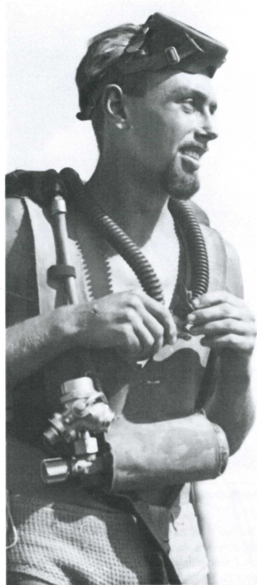
Hans Hass 1942 mit Schwimmtauchergerät.