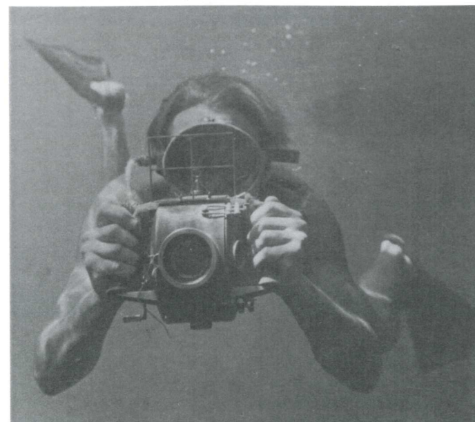
Hans Hass als Unterwasserkameramann 1950 am Roten Meer.

dort erstmals erprobten Sauerstoffkreislauf-Tauchergeräte wurden deshalb von ihm, trotz ihrer Vorteile, nach der ersten XARIFA-Expedition gegen die betriebssichereren Drucklufttauchergeräte ersetzt.