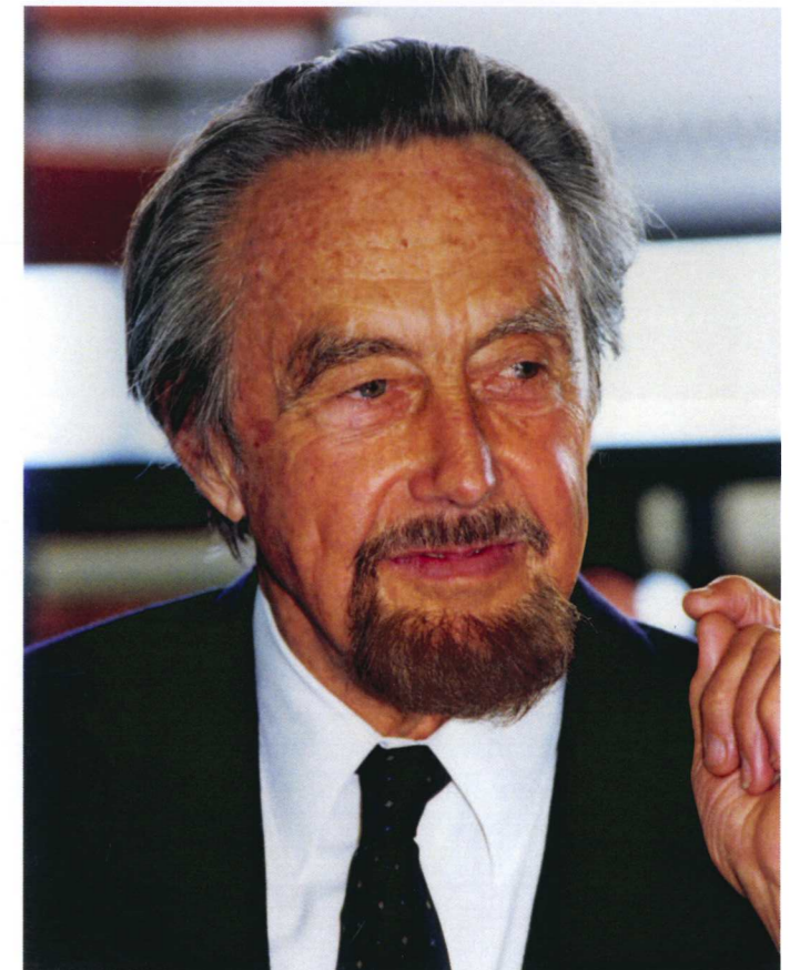
Hans Hass (1919 – 2013)