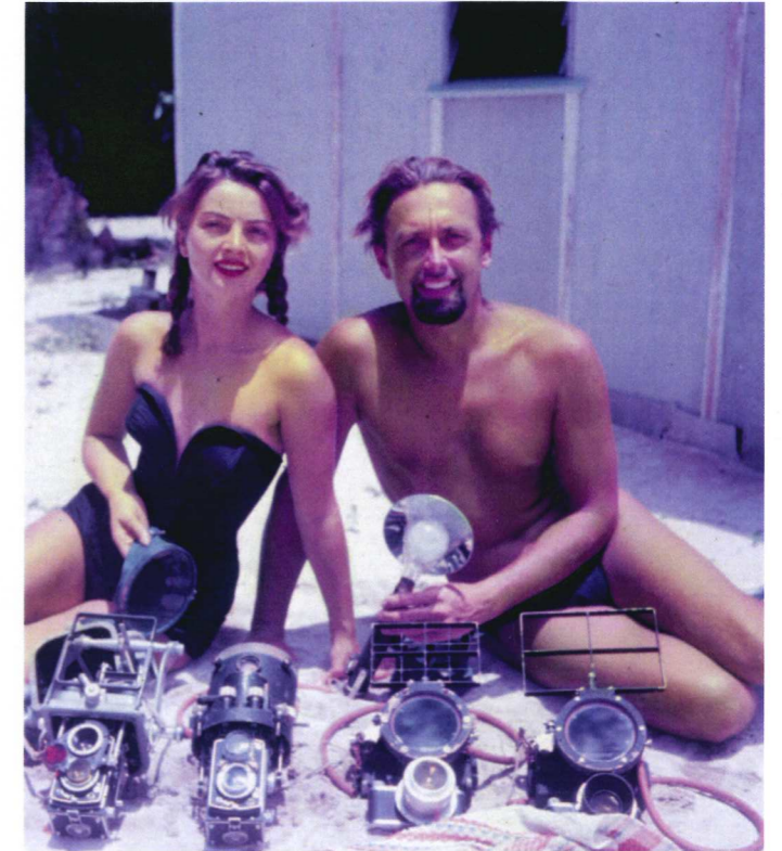
Hans und Lotte Hass waren ein „Traumpaar“ der 1950er Jahre. 1952 in Australien wurden einige neue Unterwasserkameras erprobt.

Sein Arbeitseifer, den Hans Hass von frühester Jugend bis ins hohe Alter zeigte, war die Grundlage für sein überaus produktives Lebenswerk. Es gibt keine Lebensphase, in der Hans Hass nicht von einem Vorhaben beseelt war. „Es kommt darauf an, ein Ziel zu haben. Bis zuletzt“, war sein Credo. War er in Wien, arbeitete er täglich in seinem kleinen Büroraum in der Sonnenfelsgasse. Diese Kemenate war Archiv, Büro und Wohnstätte zugleich. Hier empfing er Journalisten, brütete über Texte, telefonierte und schlief auch gelegentlich, wenn es sehr spät wurde. Aber auch an seinem Bett im Opernringhof lag stets ein Schreibblock be-